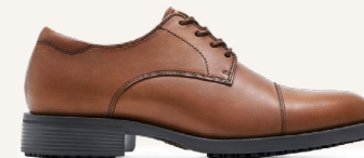
Senator Marron 1211