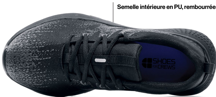
Semelle intérieure en PU, rembourrée et amovible

Poids (par chaussure) : 329 grammes (basé sur la taille 37)