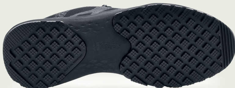
Semelle intermédiaire en EVA