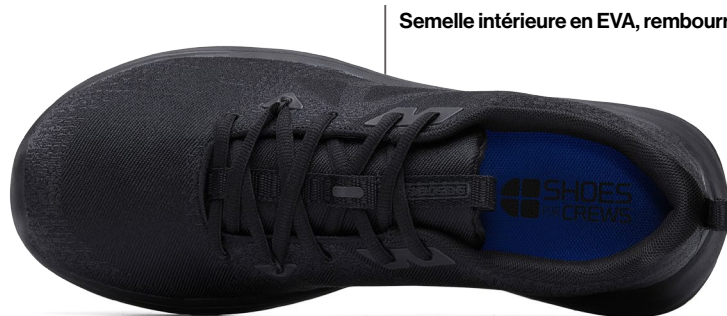
Semelle intérieure en EVA, rembourrée et amovible

Test EN ISO 20344:2021 effectué pour déterminer la résistance au glissement par Intertek Testing Services Shenzhen Ltd, en août 2022. Sur une échelle de 0 correspond à l'absence de friction et à une très forte friction (par exemple, sur un tapis sec). Toutes les chaussures SFC contiennent de la semelle extérieure antidérapante brevetée Shoes For Crews.