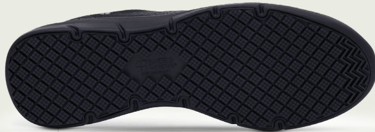
Semelle intermédiaire en EVA