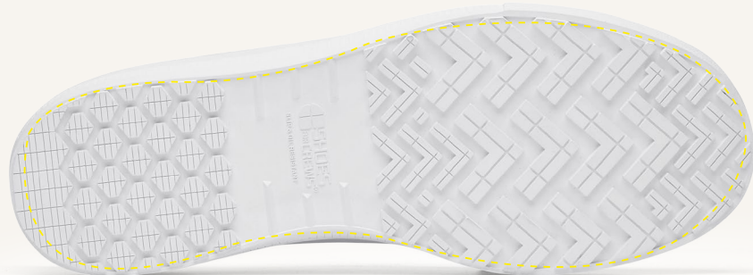
Semelle intérieure double épaisseur avec rembourrage profond

Semelle intérieure en EVA, rembourrée et amovible