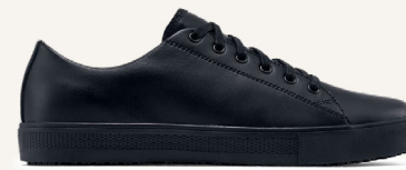
Old School Noir : 36111