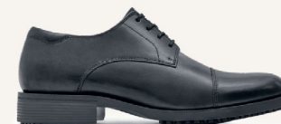
Senator Noir 1201